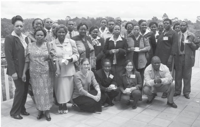
Participants at EC strategic planning workshop, Nairobi Les participants à l'atelier de planification de la stratégie EC de Nairobi

C'est à la fin de cette réunion qu'a vu le jour l'équipe « EC-Kenya » dont le but est de diriger et de canaliser les efforts préliminaires. L'équipe a brossé les points suivants: le besoin d'assurer la pérennité, la formation adéquate, la plaidoirie et le changement de politique en vue d'assurer que le EC ne puisse plus disparaître du secteur public.