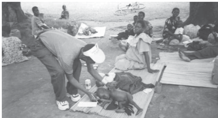
CC&RP staff attend to the needs of refugees in northern Uganda L'équipe de CC&RP en pleine assistance aux besoins de réfugiés au Nord de l'Ouganda

... I was lucky, not because I was not sexually used by those men in the bush, but because... [the dress I wore] on my day of abduction, was one where I had pocketed the EC pills I was given. Though I had never used them before, I tried them ... and indeed they worked for me. I was afraid that I had not used them as directed but I am glad I survived. Thank you so much my friends of Child Care & Rescue